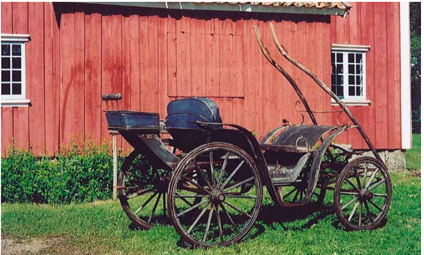
Trille/Ponnivogn fra Rakkestad